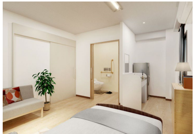
＜ 居室② ＞