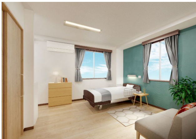
＜ 居室① ＞