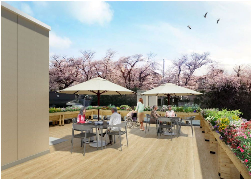
＜ ルーフバルコニー ＞