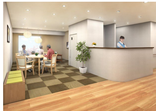
< リビング(談話スペース) >