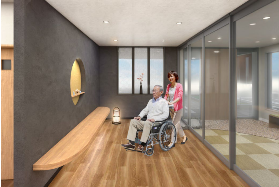
< エントランス >